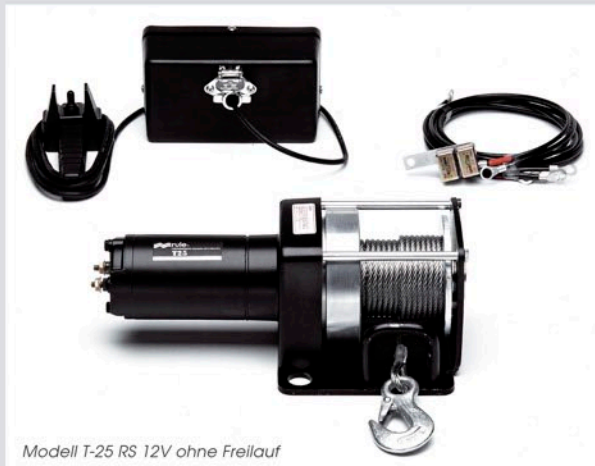
Modell T-25 RS 12V ohne Freilauf