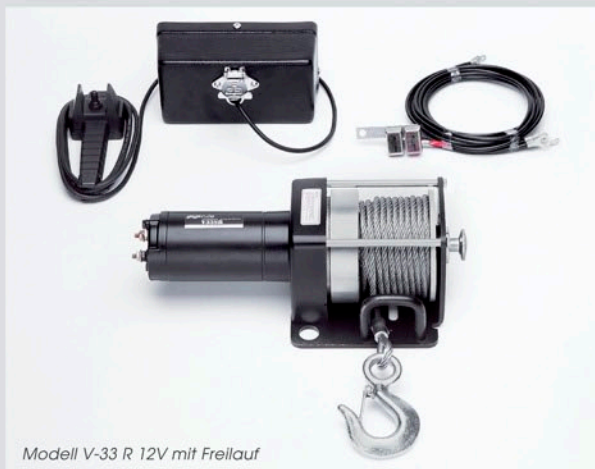
Modell V-33 R 12V mit Freilauf